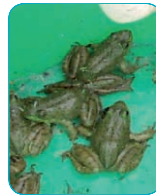
Les Grenouilles taureau ...

l'espèce ne s'était pas dispersée. Puis les moyens de lutte qui se sont révélés les plus efficaces sont pratiqués de manière intensive. Ces opérations sont menées avec le CDPNE et l'ONCFS. Un comité scientifique valide les opérations tous les ans. Le financement est assuré par la Région Centre, la DREAL et le Pays de Grande Sologne (fonds Leader). Si vous avez l'occasion d'entendre ou d'observer des grenouilles taureau, il est très important que vous ne pratiquiez pas la lutte vous-même. En effet, vous risqueriez de tuer des espèces protégées ou bien de disperser l'espèce. Des moyens publics importants sont mobilisés pour l'éradication de la grenouille taureau aussi, il vous est demandé la plus grande vigilance.