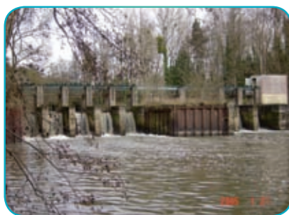
Barrage de Rouillon, 1 er obstacle à la circulation des poissons depuis la Loire

Le SEBB s'est engagé dans la lutte contre les espèces envahissantes afin de préserver la biodiversité de la Sologne