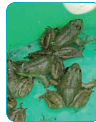
Les Grenouilles taureau ...

Des moyens publics importants sont mobilisés pour l'éradication de la grenouille taureau aussi, il vous est demandé la plus grande vigilance.